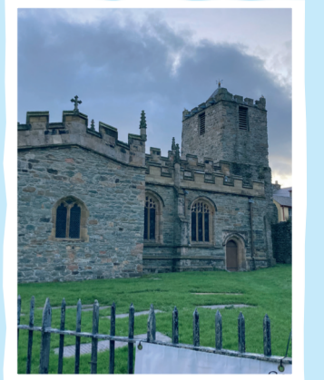
Eglwys Sant Cybi, Caergybi. St Cybi's Church, Holyhead.