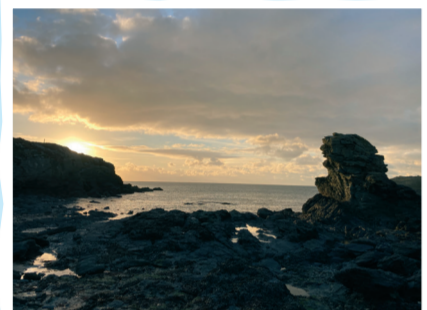
Machlud ar draeth creigiog ar hyd arfordir Trearddur. Sunset on a rocky beach along the Trearddur Bay coastline.