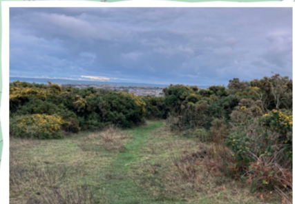
Llwyni eithin yn blodeuo gyda Caergybi yn y cefndir. Blooming gorse bushes with Holyhead in the background.