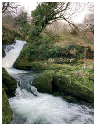
Un o sawl rhaeadr ar hyd Afon Croesor. One of several waterfalls along Afon Croesor.