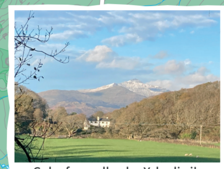
Golygfa ar y llwybr. Ychydig i'r gogledd o Benrhynddraeth. View from the trail. Just north of Penrhynddraeth.