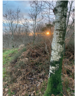
Machlud wrth ymyl cledrau rheilffordd Ffestiniog. Sunset beside the Ffestiniog railway tracks.